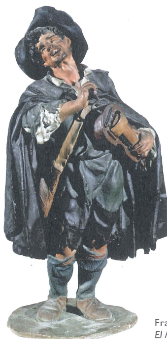
Francisco SALZILLO: El Músico Ciego .